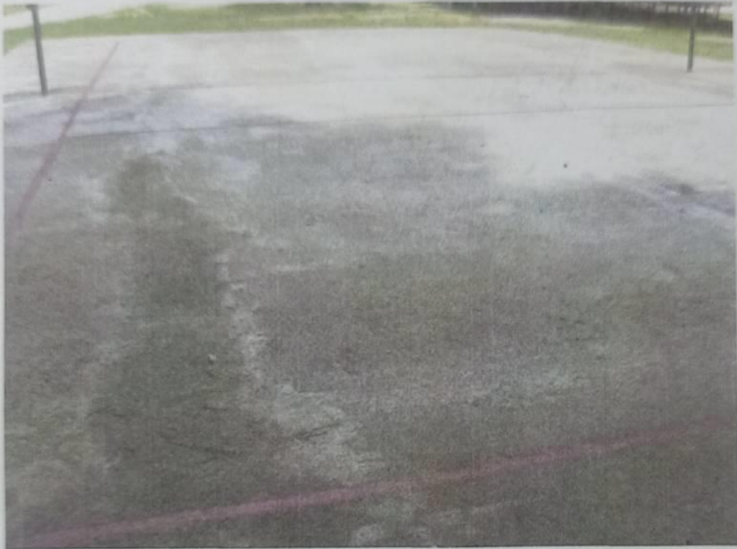
ภาพถ่าย : สนามกีฬา/ลานกีฬา หมู่ที่ ๖