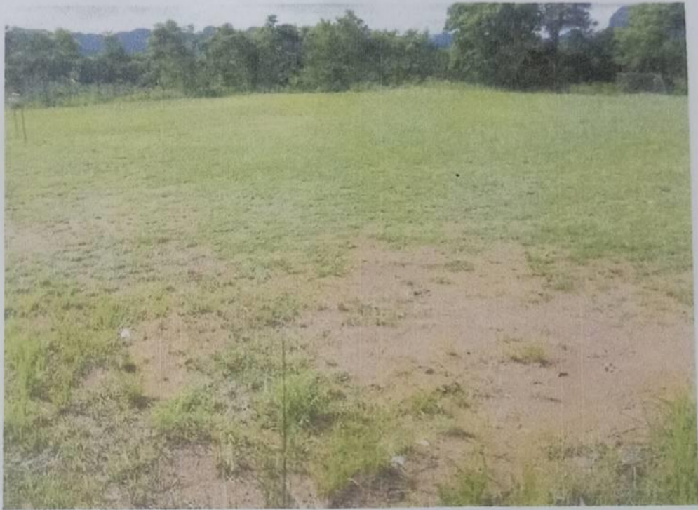
ภาพถ่าย : สนามกีฬา/ลานกีฬา หมู่ที่ 4 บ้านควนยาว